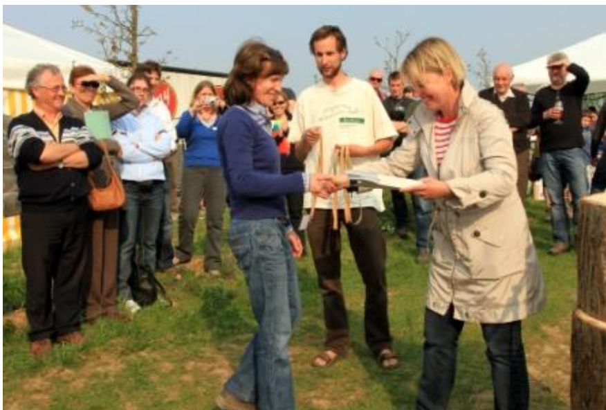
Vlaamse Ardennendag